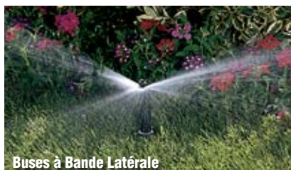
Buses à Bande Latérale