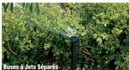
Buses à Jets Séparés