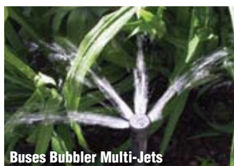
Buses Bubbler Multi-Jets