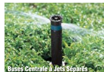
Buses Centrale à Jets Séparés