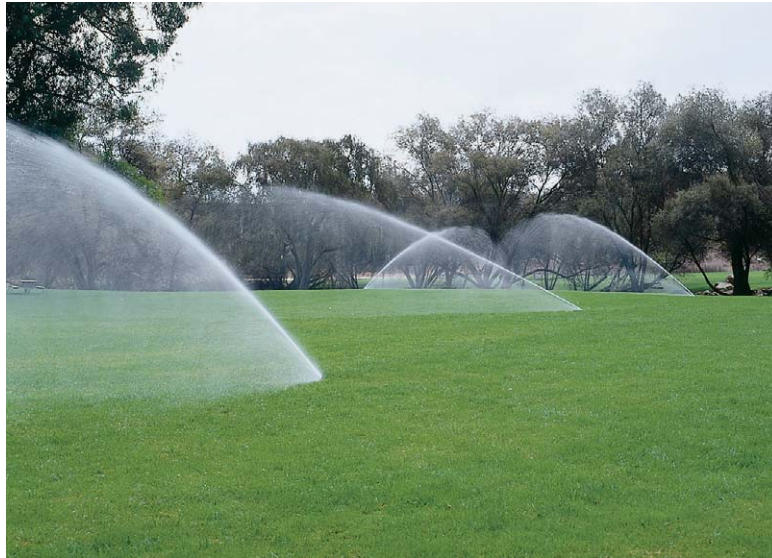
Tableau des Performances I-60 36S